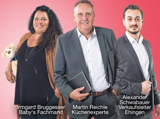
Irmgard Bruggesser Baby's Fachmarkt