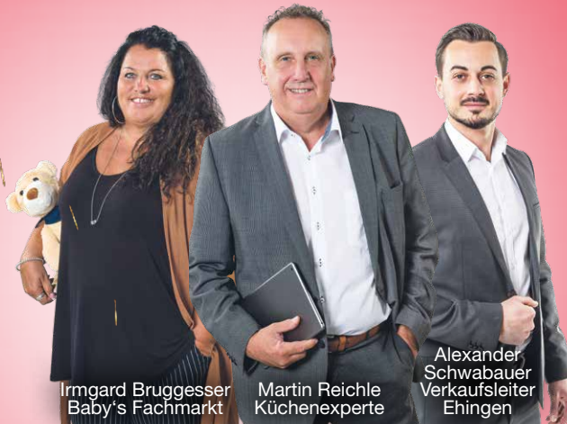
Irmgard Bruggesser Baby's Fachmarkt